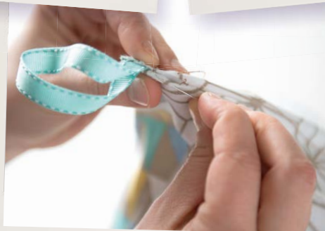
7. Nun kann man die letzte Naht mit Zauberstich von Hand zunähen.