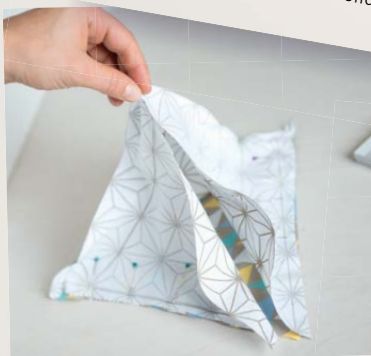
3. Das fertige Türmchen sollte nun so aussehen.