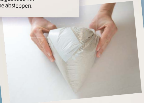
5. Den Sandsack nun zu einem Dreieck formen und das Stoffdreieck über den Sandsack stülpen.