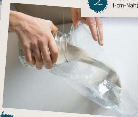
4. Den Plastiksack mit Sand füllen und die Öffnung mit Montage-Klebeband zukleben.